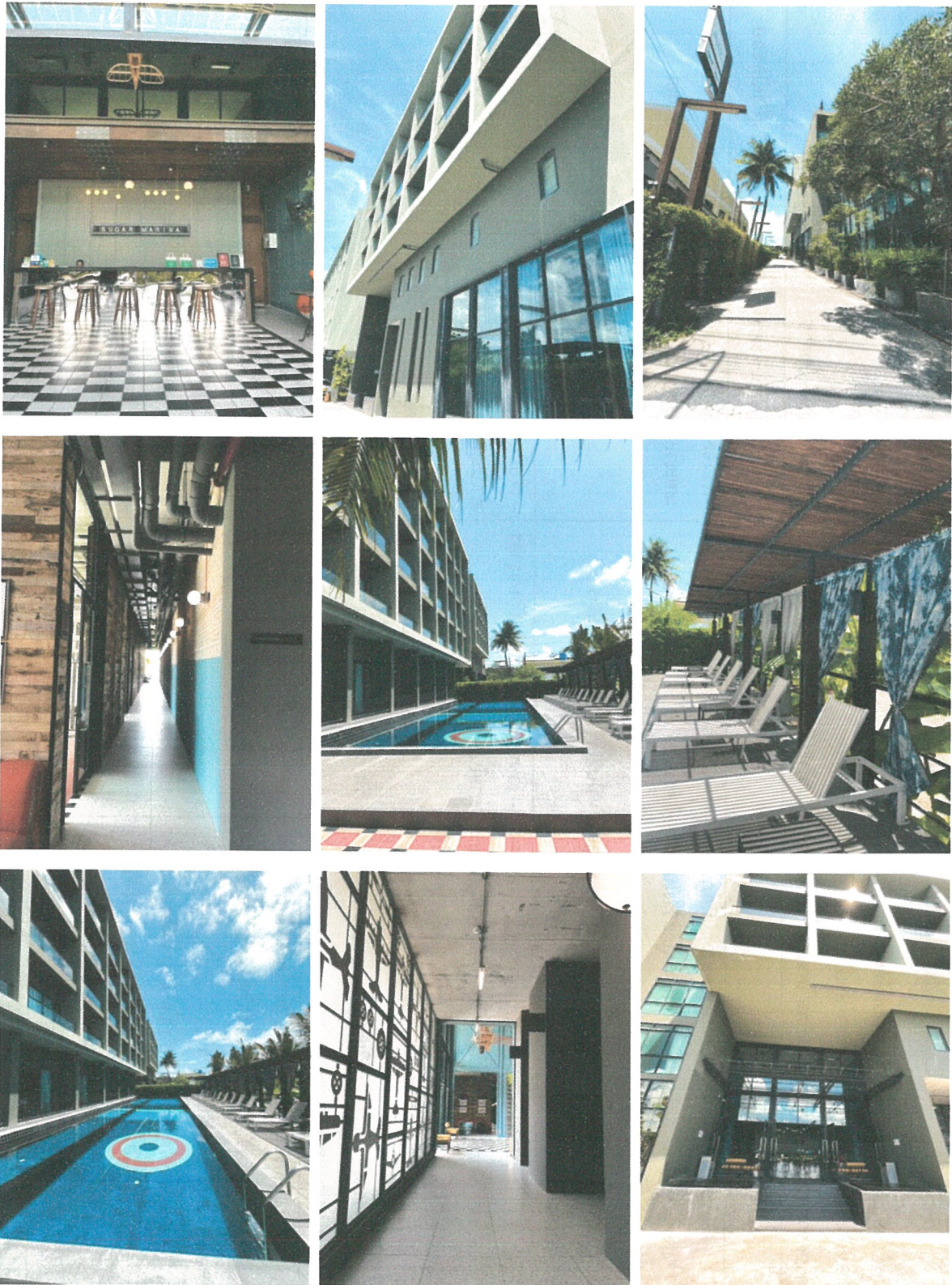
รูปภาพที่ 1.4 การใช้พื้นที่ของโครงการ